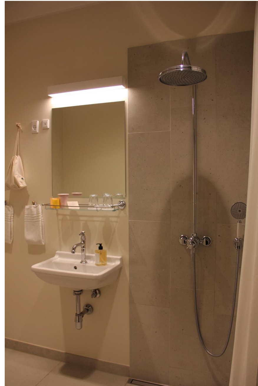
Vi sluttete dagen med en lille rundvisning på Hotel Coco.