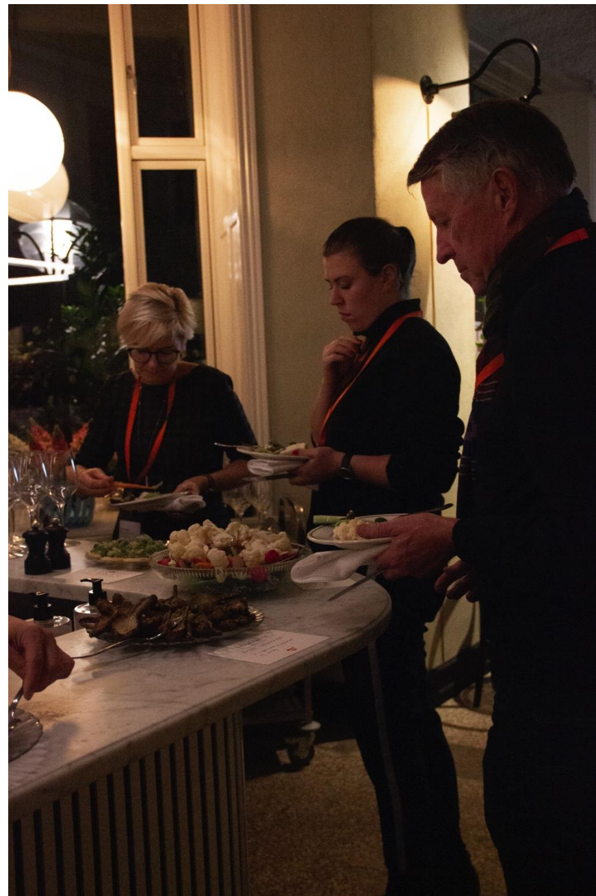
En lille pause med lækker mad fra Cofoco.